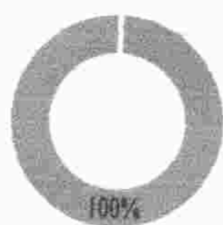
Cumplimiento Gestión EPP